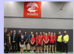
Visite du DTN et de son adjoint aux DEJEPS et au Pôle Espoir de Nîmes