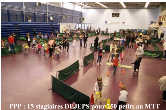
PPP : 15 stagiaires DEJEPS pour 250 petits au MTT

Les formations d' Animateurs Ping'Forme et Ping'Santé devraient lui succéder en 2016. Nous faisons en tout cas, tout pour accélérer le processus qui a pris un peu de retard en étant devenu « affaire nationale » !