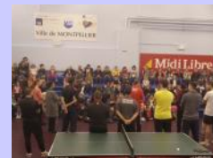
PPP au Montpellier TT : 250 scolaires de 4 à 6 ans animés par les DEJEPS 2014 !