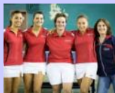
Remontée de l'équipe féminine de St Christol-lez-Alès en Nationale 2

« L'ASPC Nîmes devra batailler pour obtenir le maintien en PRO B Dames »