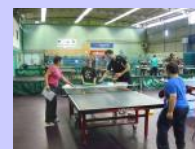
En séance avec le public de l'IME du Château d'O

...deux autres formations AF doivent avoir lieu début 2015 !