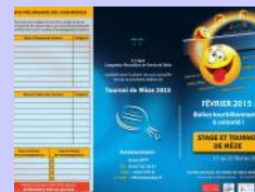
TIM... 10ème édition