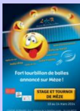
Affiche Stage et Tournoi International Jeunes de Mèze

« Le TOURNOI INTERNATIONAL DE MEZE clôturera une semaine riche en événements, dont un stage de 80 jeunes, une formation Pilote de 11 éléments et un Colloque de cadres »