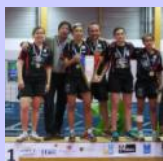
Le titre de Nationale 2 Dames remporté par l'ASPC Nîmes et la montée en N2 pour l'AP Narbonne !

« Après la réforme du Championnat par équipes, celle du Critérium Fédéral de Nationale 1 aura des répercussions sur les divisions inférieures »