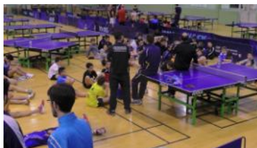
Présentation et Briefing Stage

Les tables du gymnase, chèrement disputées entre stagiaires, pilotes et cadres du colloque, ont finalement été assez bien gérées pour que chacun puisse pratiquer les ateliers prévus dans le cadre de son programme respectif. Ainsi, les trois actions organisées en parallèle ont-elles pu être menées de la manière la plus satisfaisante possible.