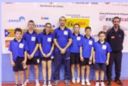
Sélection Languedocienne au Tournoi International de Catalogne

« Après la réforme du Championnat par équipes, celle du Critérium Fédéral de Nationale 1 aura des répercussions sur les divisions inférieures »