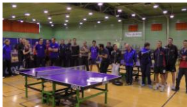
Réunion des Cadres