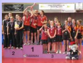
Médaille d'Or pour notre équipe cadette au Championnat de France des Régions