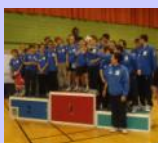
Challenge par équipes remporté par la ligue Midi-Pyrénées

« Le TOURNOI INTERNATIONAL DE MEZE clôturera une semaine riche en événements, dont un stage de 80 jeunes, une formation Pilote de 11 éléments et un Colloque de cadres »