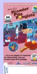
Un Flyer rose pour les filles

« Le PREMIER PAS PONGISTE se modernise et devient un outil essentiel pour le recrutement des plus jeunes »