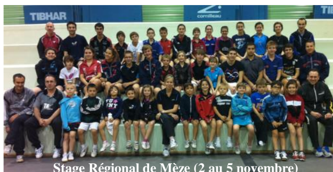
Stage Régional de Mèze (2 au 5 novembre)

...Les garçons ne sont pas passés loin puisque Marc LAUCOURNET échoue en finale des Juniors et Adrien CHAPIRON des Minimes.