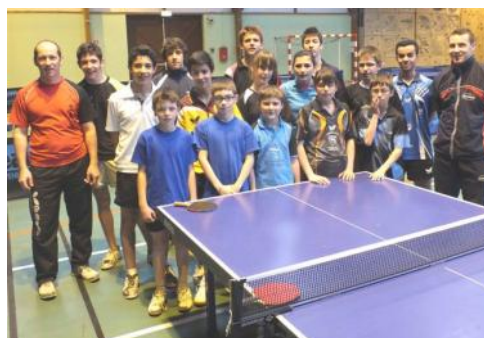
Stage Pôle et Elite Régional