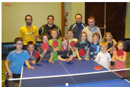
Stage GRD et préparation Mini-Interligues