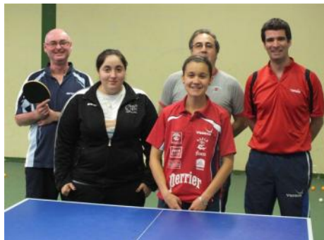
Formation Entraîneurs Fédéraux