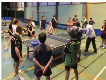
Stage Elite Départemental