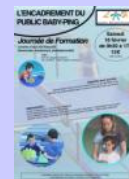
Formation BABY PING « Le Ping pour les 4-7 ans »