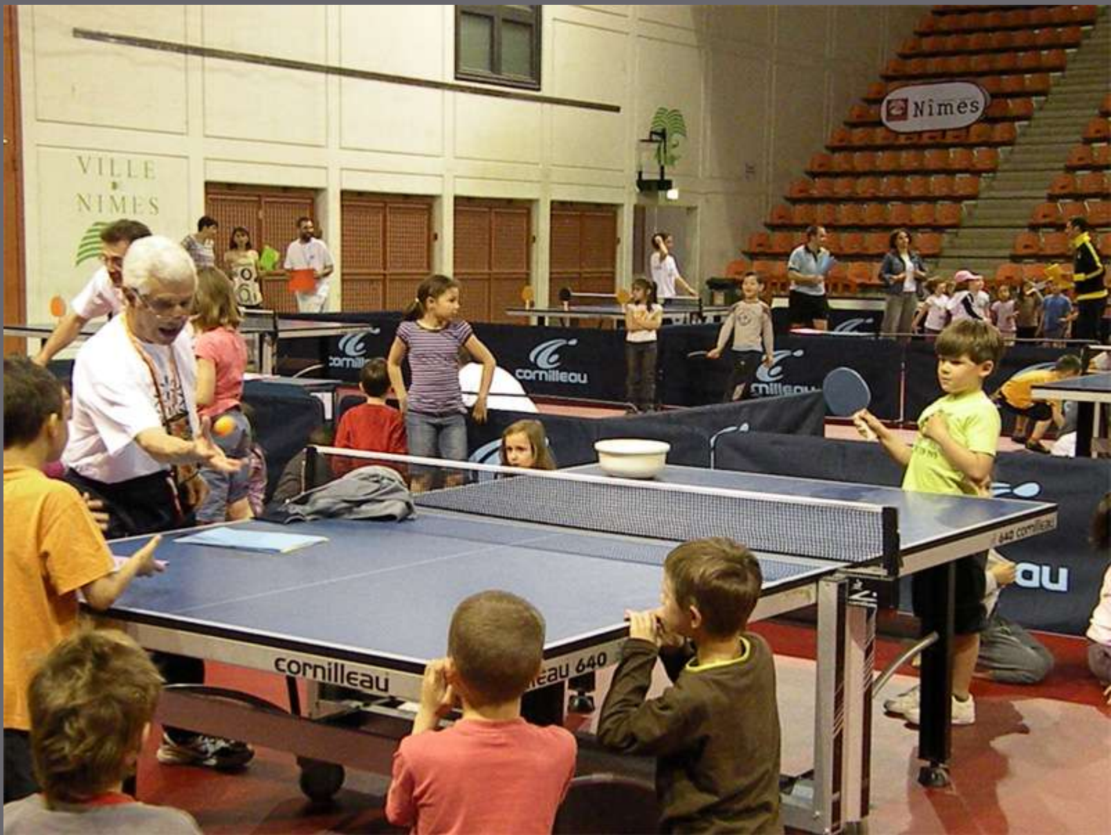
Ping des pitchounes