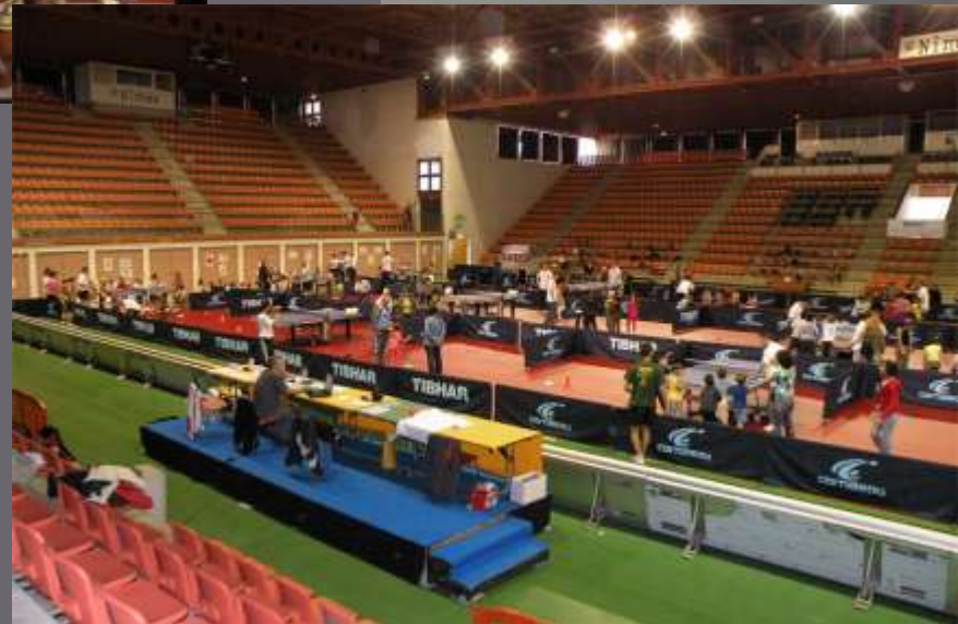
Ping des pitchounes