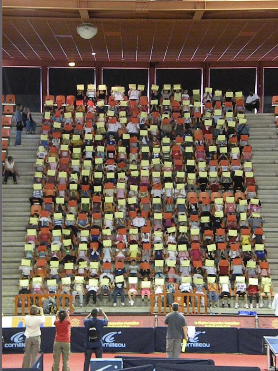
Ping des pitchounes